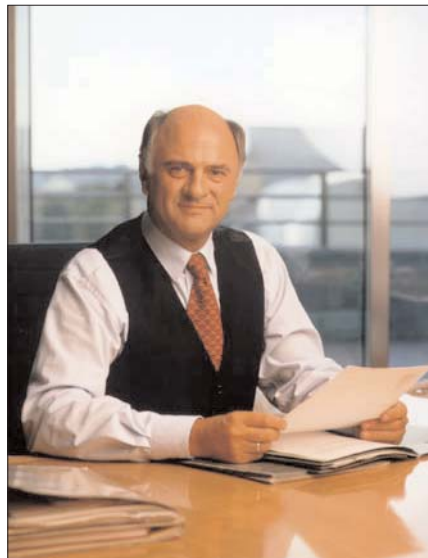
LH Dr. Erwin Pröll

verstehen, wenn Sie schon einige Zeit fern der eigenen Heimat leben, daß wir irgendwie noch immer ein Imageproblem haben. Das wird zwar allerdings zunehmend kleiner, wir haben aber noch immer das Gefühl nicht abgelegt, das entstanden ist durch den Zwang unserer Heimat, am Eisernen Vorhang und gleichzeitig im Schatten der Bundeshauptstadt Wien leben zu müssen. Das hat über Jahre und Jahrzehnte, insbesondere zur Zeit