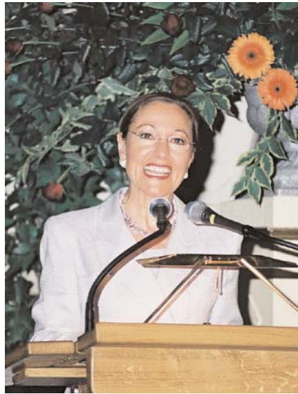
Bundesministerin für auswärtige Angelegenheiten, Dr. Benita Ferrero-Waldner