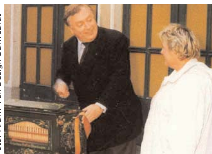
... der populäre Wiener Bürgermeister Dr. Michael Häupl auch beim Drehen der Kurbel routiniert zeigt

Menschen hatten zu jener Zeit anderes im Kopf, als in den Prater zu gehen. Überall fehlte es am Notwendigsten. Und so dauerte es bis in die 70er-Jahre, in denen sich der „Böhmische“ von den Wunden des Krieges und von der Armut in der Nachkriegszeit schön langsam erholte.