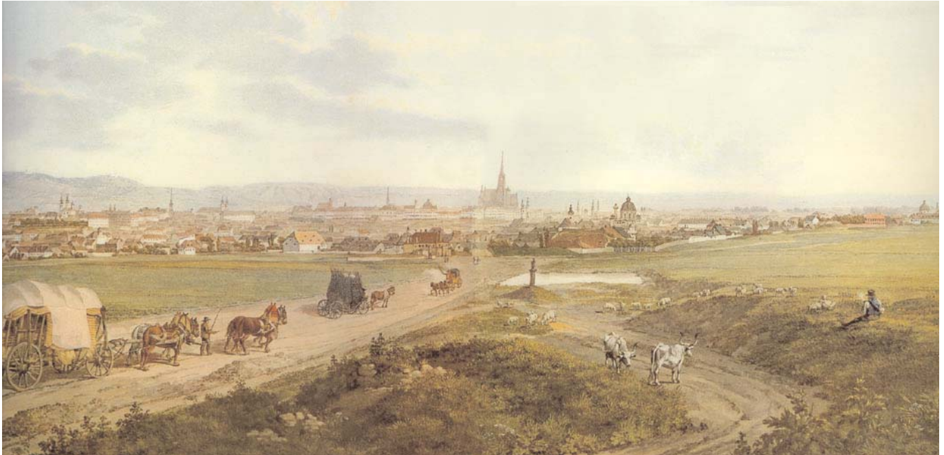
Ein Blick vom Wienerberg in Favoriten auf Wien – im Vordergrund die »Spinnerin am Kreuz«, dahinter der »Stephansdom«

Welcher (Wiener) Autofahrer ist nicht schon einmal auf der Triester Straße in einem Stau steckengeblieben. Der Blutdruck steigt an, unflätige Worte schwirren in der Luft und finden – bisweilen – auch den Weg durchs offene Autofenster. Sinnloses Hupen erhöht den Lärmpegel, ohne daß sich am Stau auch nur das geringste ändern würde. Wenn Sie, lieber, genervter Autofahrer, dort wiedereinander im Stau stecken bleiben sollten, nehmen Sie unser „Österreich Journal“ zur Hand und nützen Sie die Gelegenheit, während dieser Zeit ein wenig über die Geschichte dieses Bezirkes, ihres „vorübergehenden Wohnsitzes“, den sogenannten „10. Hieb“, nachzulesen.