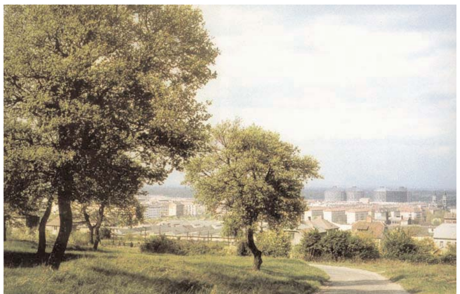
Blick vom Laaerberg auf die zu Wohnbauten umfunktionierten Gasometer

Die Triester Straße war einmal eine sehr wichtige Verkehrslinie nach – Sie wissen es, wie könnte es auch anders sein – Triest über