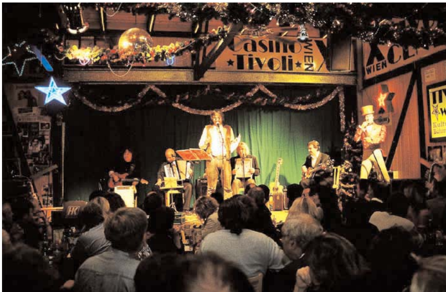
Eine der Veranstaltungen im »Club Tivoli« war die CD-Präsentation der Gruppe »Wiener Blue(s)«, über die Sie in einer unserer nächsten Ausgaben lesen können

nehmen (etwa 15 Minuten). Faszinierend, daß der Schotterboden, auf dem man hier spaziert, für Waldbestand gar nicht geeignet war. Unter schwierigsten Bedingungen hat das Forstamt der Stadt Wien von 1956 bis 1970 die immense Zahl von 270.000 Bäumen auf mehr als 40 Hektar gepflanzt. Die öde Industrielandschaft, damals geprägt durch Armut und Elend, hat sich in ein Paradies verwandelt und sich zu einem Erholungs- und -lebensraum für Mensch und Tier gestaltet, sogar gefährdete Vogelarten finden hier ein prächtiges, geschütztes Rückzugsgebiet. Viele Jahre mußte dieses Gebiet gesperrt bleiben, damit der Baumbestand überhaupt die Möglichkeit hatte sich zu entwickeln. Dieses Gelände ist eingezäunt und täglich von 8 Uhr morgens bis zum Einbruch der Dämmerung geöffnet.