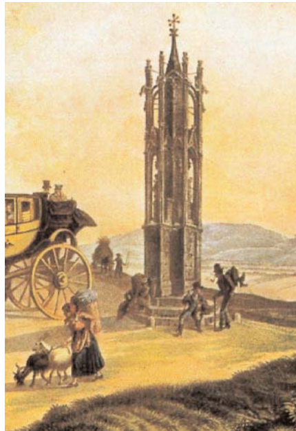
Die »Spinnerin am Kreuz«

Die Spinnerin am Kreuz (für jeden Autofahrer rechter Hand stadtauswärts gut sichtbar) ist das Wahrzeichen von Favoriten. Sie wurde 1296 erstmals urkundlich erwähnt. Durch Türkeneinfälle wurde sie jedoch zerstört und 1451 durch eine neue, gotische