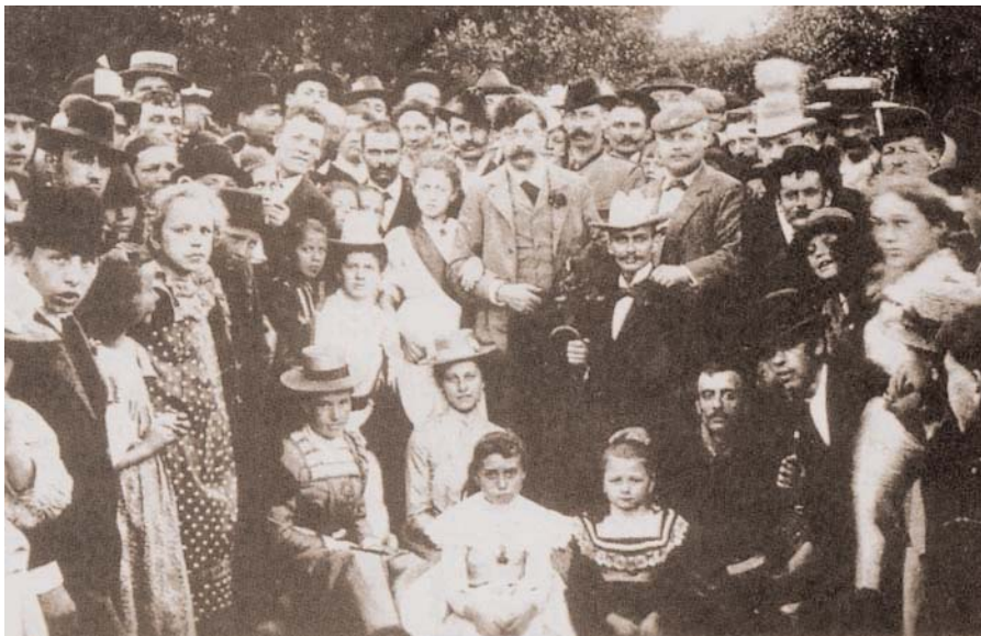
Dem berühmten Sozialdemokraten Viktor Adler gelang es, Elend und Armut der Arbeiter am Wienerberg zu lindern

Massive Erdbewegungen durch die Gemeinde Wien lassen aus öden Industriegründen Naherholungsgebiete für alle Wiener entstehen